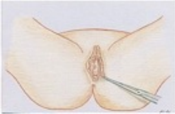
Fig. 3 - Asportazione chirurgica